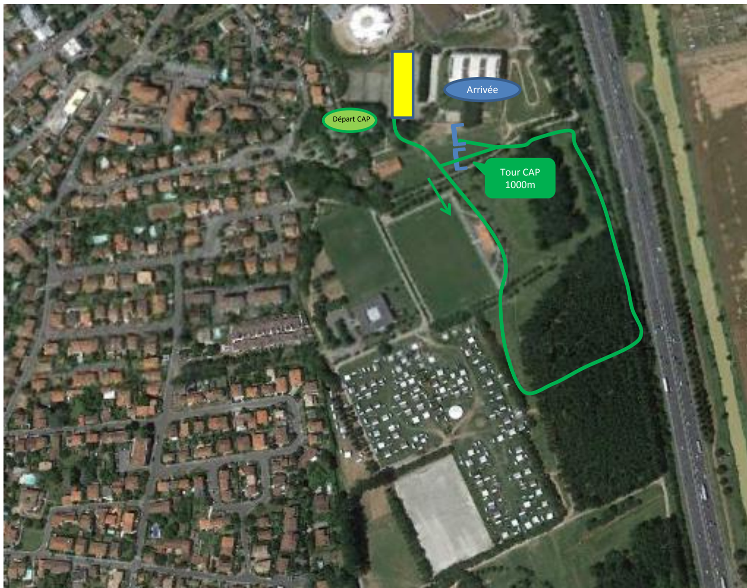
Parcours Triathlon des Roses Course à Pied 2000m (2 tours de 1000 m)